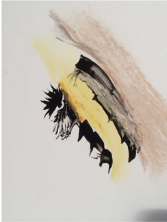
Tränen für das Hochmoor 1992